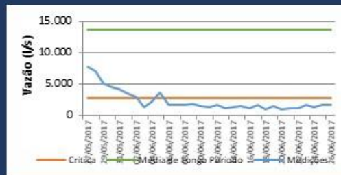
Histórico de Vazão nos últimos 30 dias