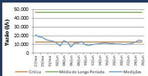
Histórico de Vazão nos últimos 30 dias