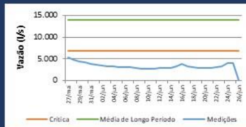
Histórico de Vazão nos últimos 30 dias