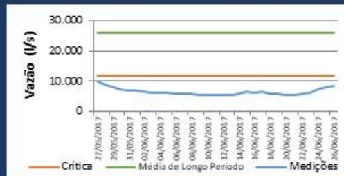
Histórico de Vazão nos últimos 30 dias