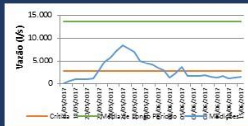
Histórico de Vazão nos últimos 30 dias