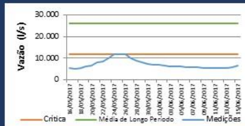
Histórico de Vazão nos últimos 30 dias