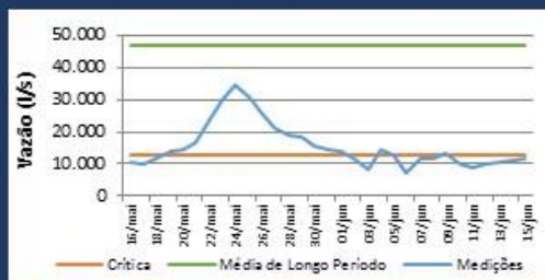
Histórico de Vazão nos últimos 30 dias