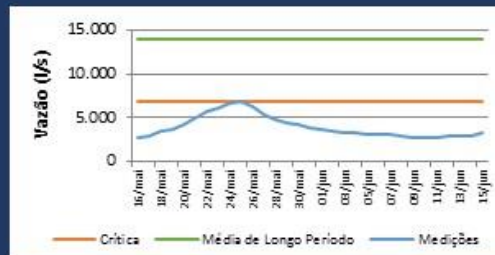
Histórico de Vazão nos últimos 30 dias