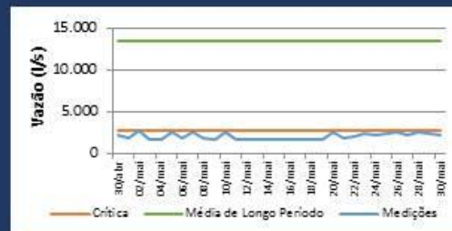
Histórico de Vazão nos últimos 30 dias