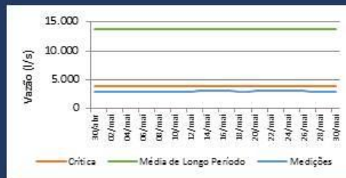
Histórico de Vazão nos últimos 30 dias