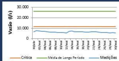
Histórico de Vazão nos últimos 30 dias