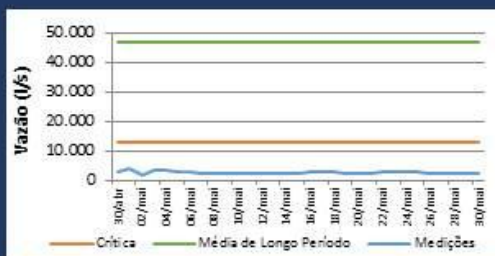
Histórico de Vazão nos últimos 30 dias