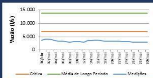
Histórico de Vazão nos últimos 30 dias